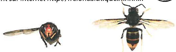
Frelon asiatique à pattes jaunes, Vespa velutina

Le frelon asiatique à pattes jaunes, Vespa velutina , est à dominante noire, avec une large bande orange sur l'abdomen et un liseré jaune sur le premier segment. Sa tête vue de face est orange, et les pattes sont jaunes aux extrémités. Il mesure entre 17 et 32mm.