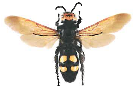
Scolie des jardins, Megascolia maculata flavifrons

La scolie des jardins fait partie des plus imposantes "guêpes" européennes. Elle est de ce fait fréquemment confondue avec le frelon asiatique. Sa pilosité est très épaisse. Son corps est noir brillant, sa tête est jaune sur le dessus et elle possède 4 zones jaunes et glabres sur l'abdomen. C'est un parasite de larves de gros Coléoptères (comme le Hanneton).