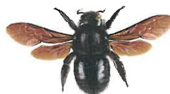
Xylocope ou abeille charpentière, Xylocopa violacea

L' abeille charpentière mesure entre 2 et 3 cm. C'est l'une des plus grandes abeilles européennes. Elle est entièrement noire avec des reflets bleu violacés. Elle construit son nid dans le bois mort et nourrit ses larves de pollen.