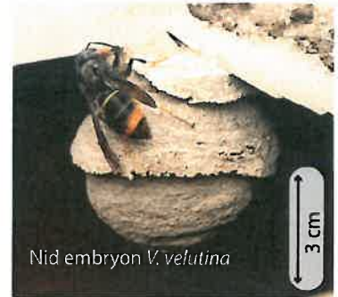
Nid embryon V. velutina

Au printemps, chaque reine fondatrice construit seule son nid dans un lieu souvent protégé. Chez la plupart des guêpes le nid embryon ressemble à une petite sphère de 5 à 10 cm de diamètre avec une ouverture vers le bas. Chez les frelons, la colonie n'hésitera pas à déménager si l'emplacement ne convient plus (manque de place, de sécurité).