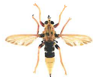
Asile frelon, Asilus crabroniformis