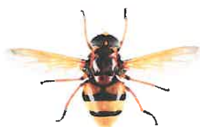
Volucelle zonée, Volucella zonaria

De nombreuses mouches (Diptères) peuvent ressembler à des guêpes ou des frelons. Mais à la différence de ceux-ci elles ne possèdent qu'une seule paire d'ailes au lieu de deux. Leurs yeux sont généralement beaucoup plus globuleux et leurs antennes plus courtes.