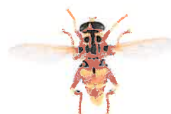
Milésie faux-frelon, Milesia crabroniformis