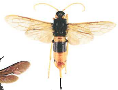
Sirex géant, Urocerus gigas

Le sirex géant est un Hyménoptère dont la larve se nourrit de bois. La femelle peut atteindre 4,5 cm, a une coloration proche du frelon asiatique, mais s'en distingue facilement par des antennes longues entièrement jaunes ainsi que par la présence d'une longue tarière lui permettant de pondre dans le bois. Cet insecte est inoffensif.