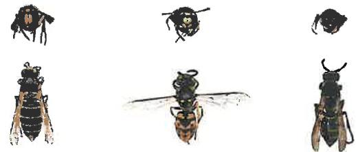
Guêpe des buissons, Dolichovespula media

Les guêpes sont plus petites que les frelons. Les ouvrières mesurent environ 15mm en fin d'été. Attention, une reine de guêpe peut dépasser légèrement 20mm, c'est-à-dire la taille du frelon asiatique représenté ici sans la tête. Au printemps les guêpes peuvent donc être plus grande que les premières ouvrières de frelon.